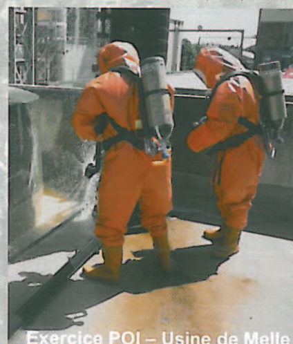
Exercice POI – Usine de Melle

Le préfet, prévenu par l'industriel, prend la direction de l'ensemble des moyens d'intervention à mettre en œuvre dans le cadre du Plan Particulier d'Intervention (PPI). Il met également en œuvre les mesures de protection des populations.