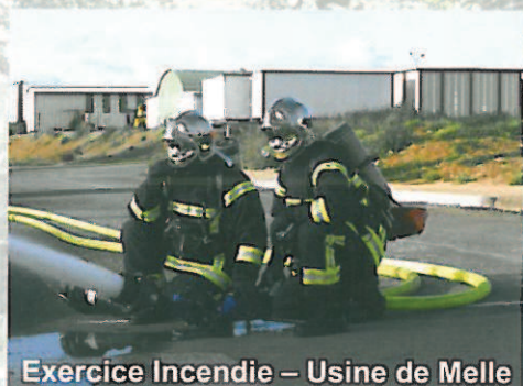
Exercice Incendie – Usine de Melle